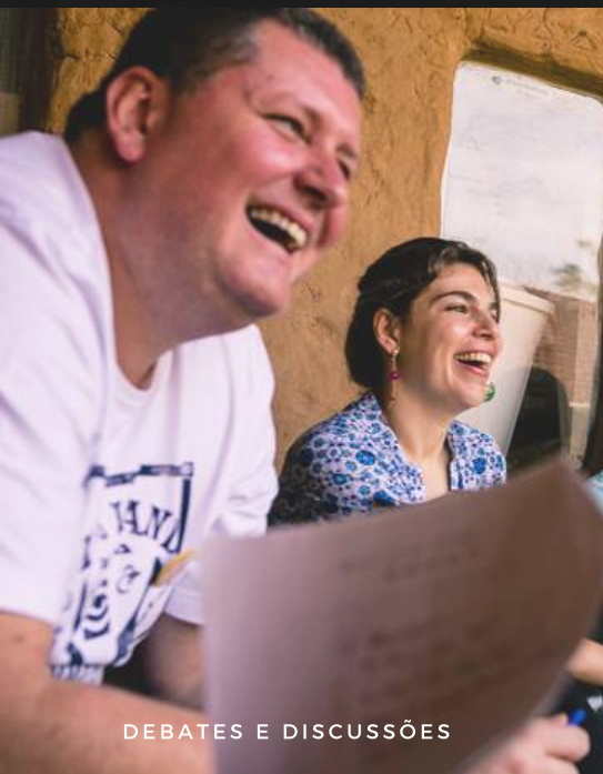
DEBATES E DISCUSSÕES