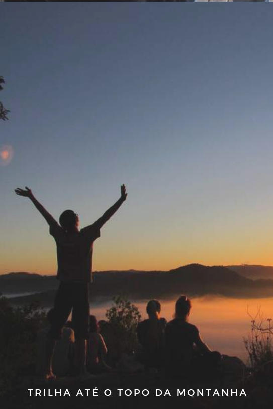
TRILHA ATÉ O TOPO DA MONTANHA

AS ATIVIDADES OCORREM DE FORMA SIMULTÂNEA, ASSIM O PARTICIPANTE SEMPRE PODE OPTAR PELA QUE MAIS LHE INTERESSA VIVENCIAR.